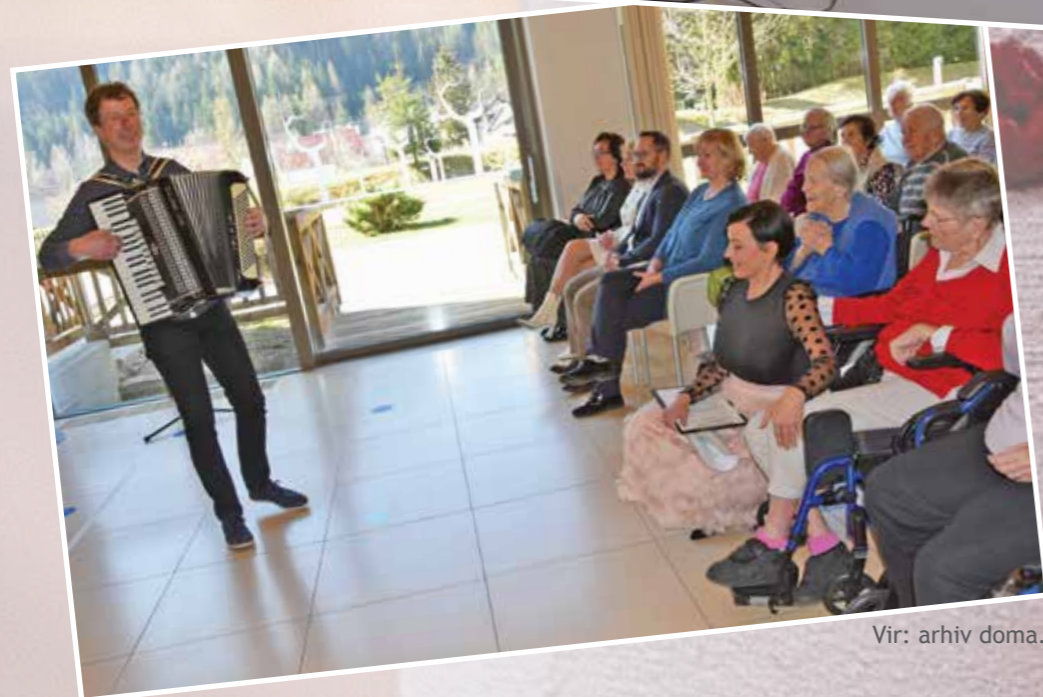
Vir: arhiv doma.