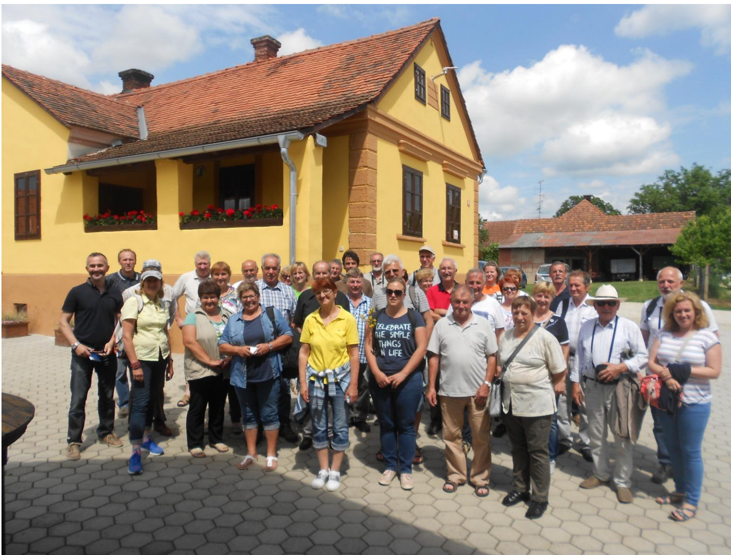
Skupinska slika udeležencev strokovne ekskurzije