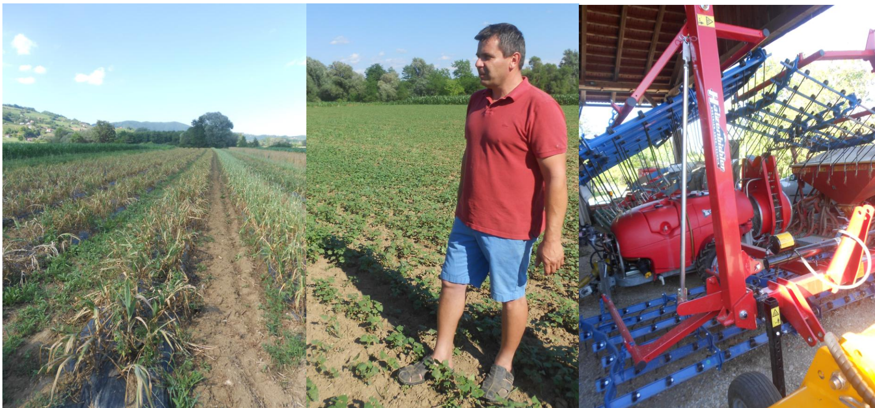
Polje česna, ajde in česalo