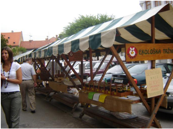
Ekološka tržnica v Novem mestu 10.8.2007