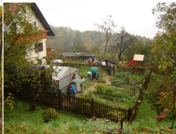
Domačija Cojhter 24.10.2007