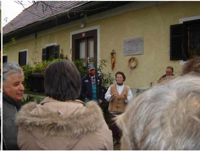
Ekološka kmetija Metz 24.10.2007