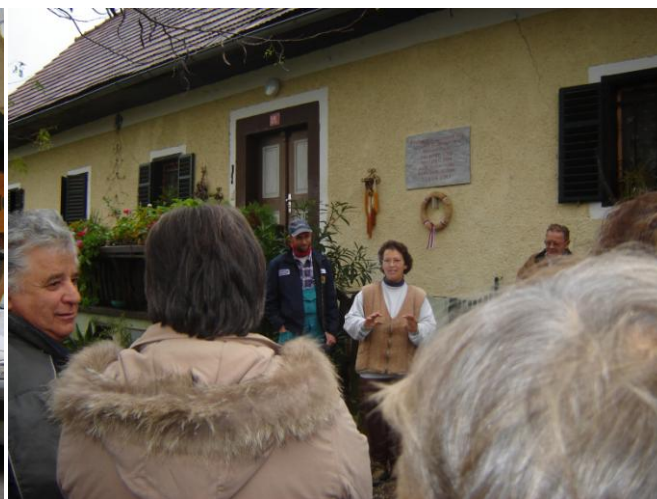
Ekološka kmetija Metz 24.10.2007