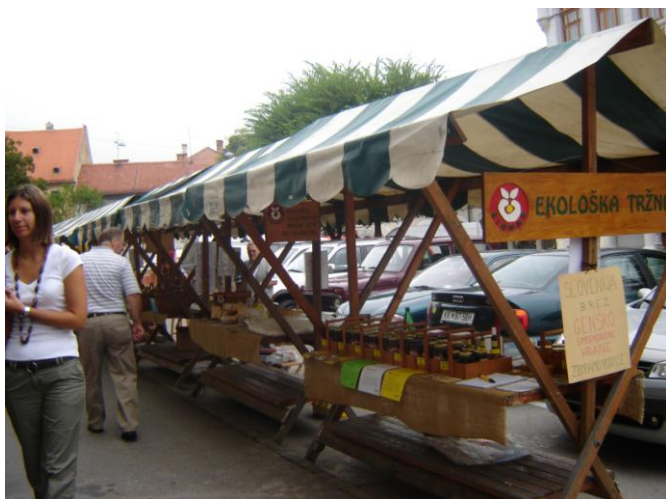
Ekološka tržnica v Novem mestu 10.8.2007