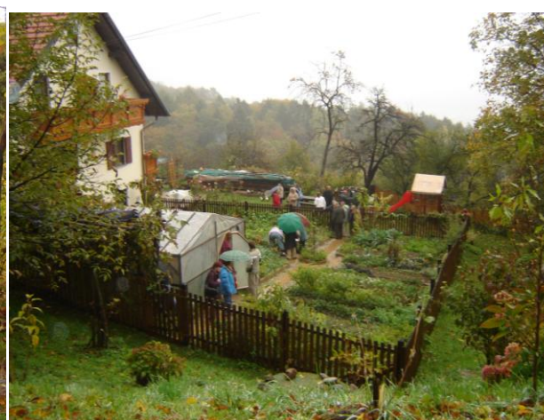
Domačija Cojhter 24.10.2007