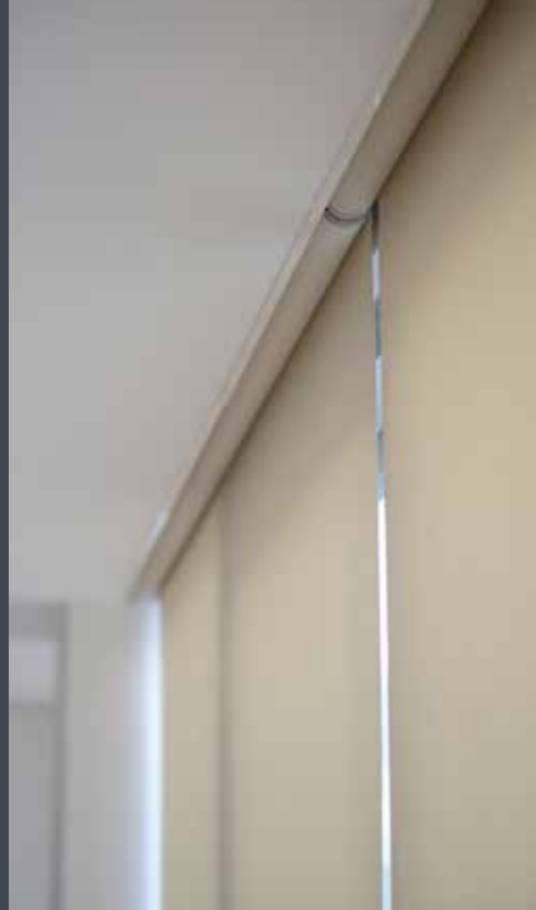
Vertikalni screen roloji