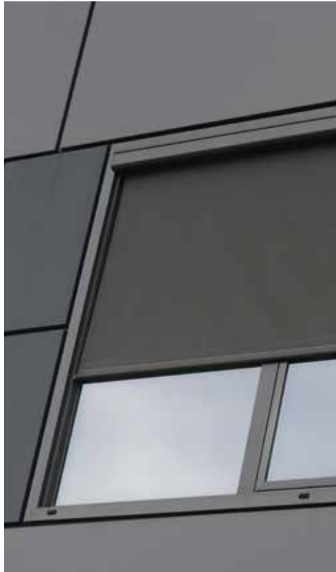
Vertikalni screen roloji