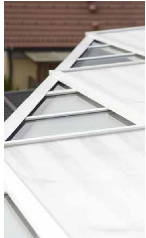
Horizontalni screen roloji