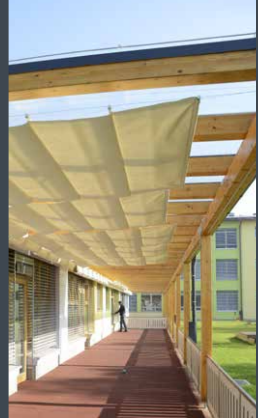
Horizontalni screen roloji