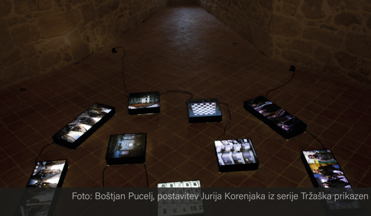
Foto: Boštjan Pucelj, postavitev Jurija Korenjaka iz serije Tržaška prikazen

Informacije: E: info@mestnimuzejkrsko.si T: 07 620 92 44